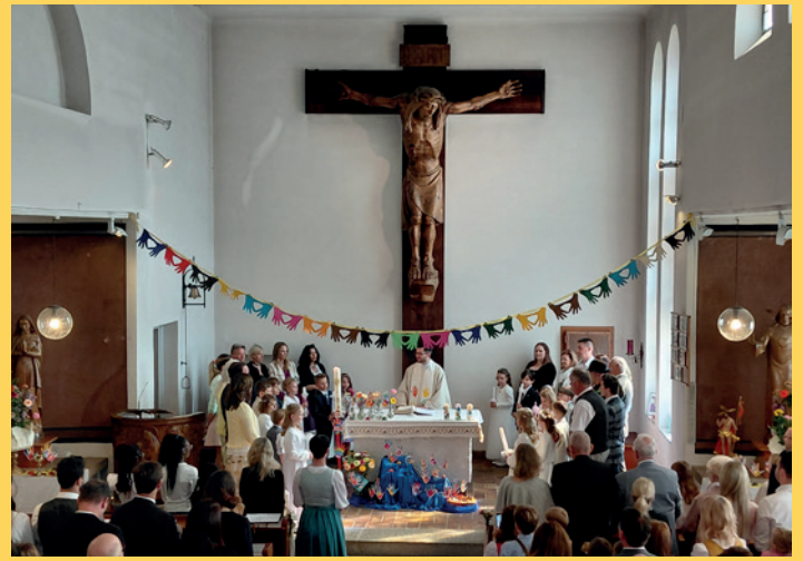
Erstkommunion | Aual