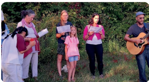
Spaziergang mit Musikpausen