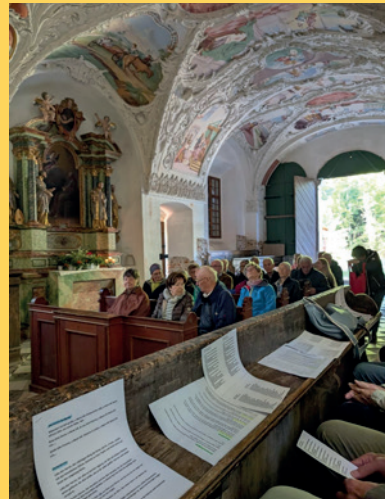
Florianiwallfahrt | St. Paul