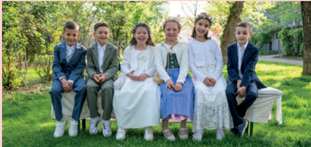
VS Liebenau | Graz-Süd