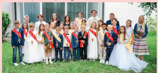
VS Murfeld | St. Christoph in Thondorf | © lilagestreift