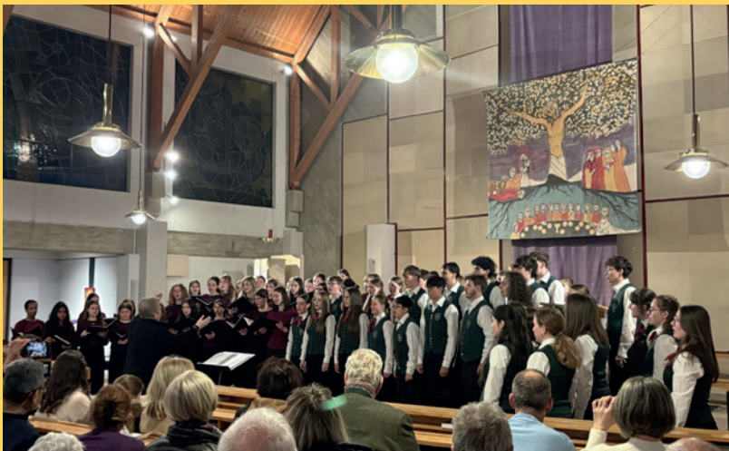
Mädchenkantorei Basel & HIB.art.chor | St. Paul