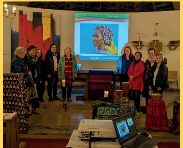
Weltgebetstag der Frauen | Hohenrain