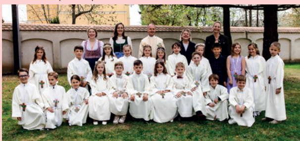
VS St. Peter | St. Peter