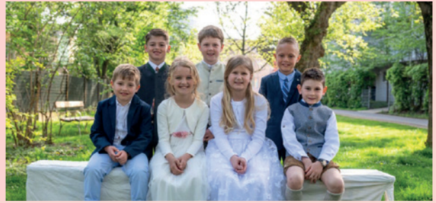
VS Liebenau | Graz-Süd