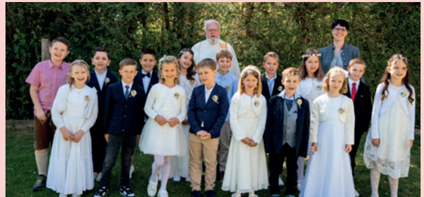
VS Pachern | Hohenrain | © Markus Allram