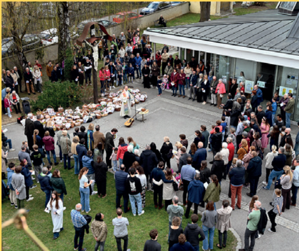
Osterspeisensegnung | St. Peter