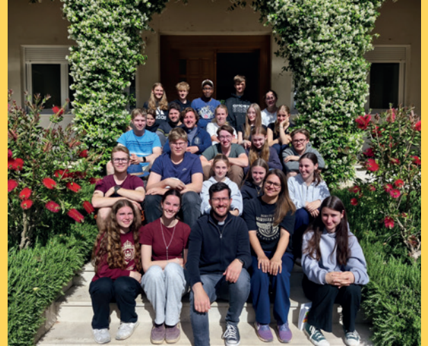
Jugendreise nach Medjugorje