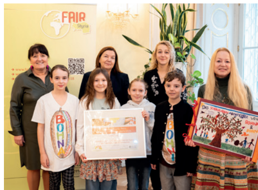
Die UNESCO-Volkschule Eisteich beschäftigte sich mit Fragen rund um Kakao, Schokolade und fairen Handel