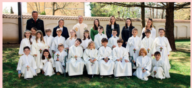
VS St. Peter | St. Peter