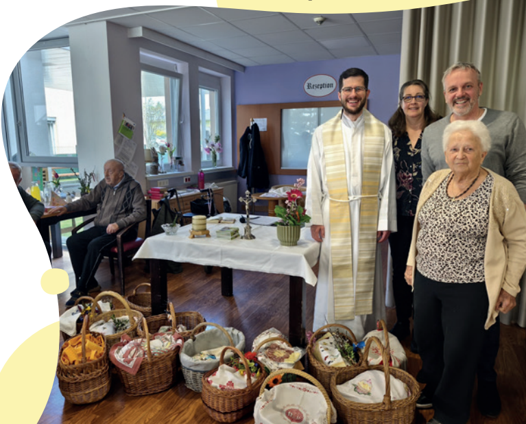
Osterspeisensegnung in Autorial