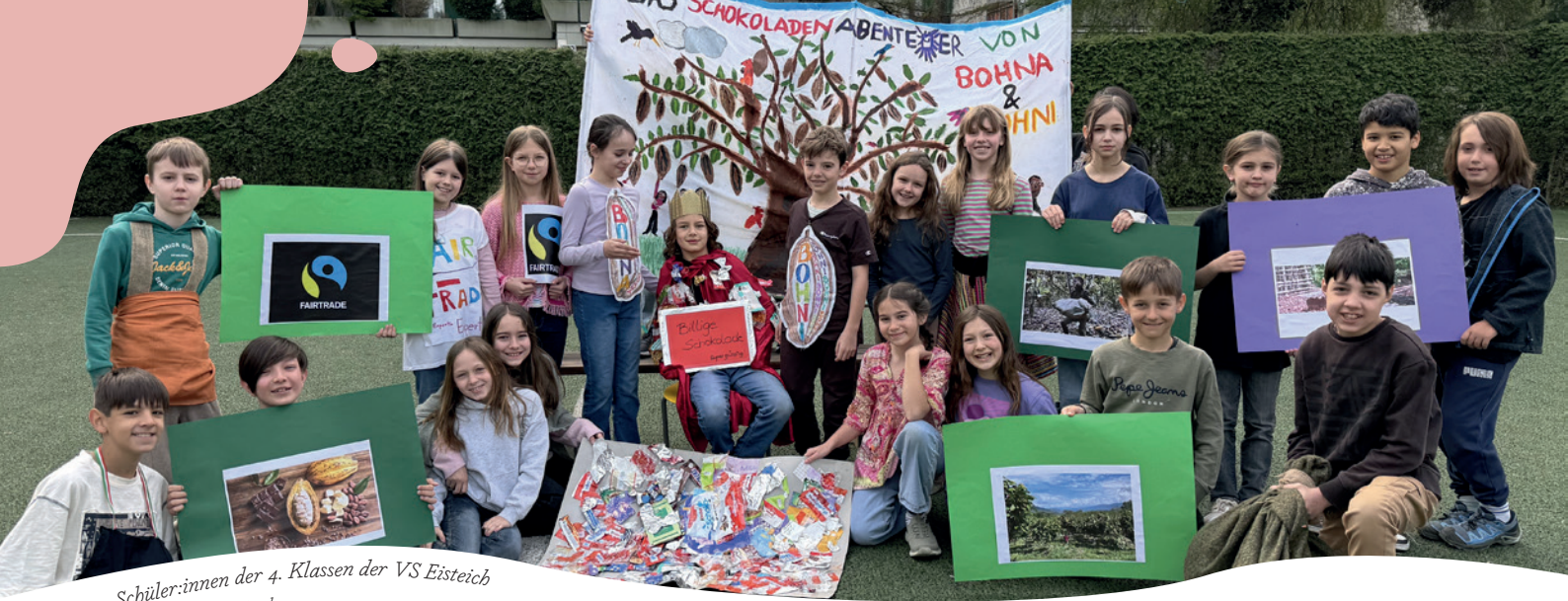
Schüler:innen der 4. Klassen der VS Eisteich