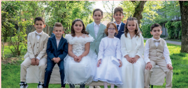
VS Liebenau | Graz-Süd | © Helmut Jokesch