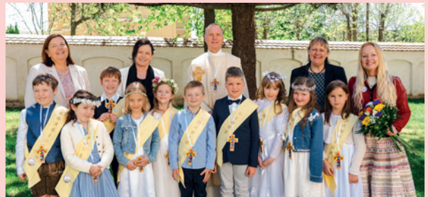
VS Eisteich | St. Peter