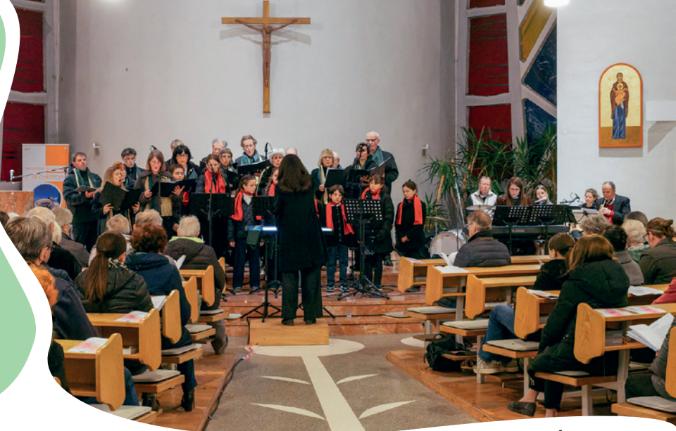
Musicalmesse St. Christoph