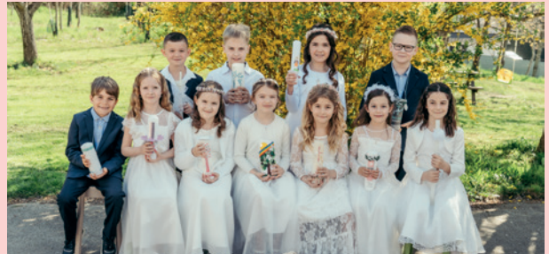
VS Raaba | Messendorf | © lilagestreift