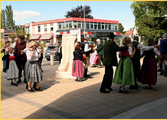
Steirischer Gottesdienst | St. Christoph