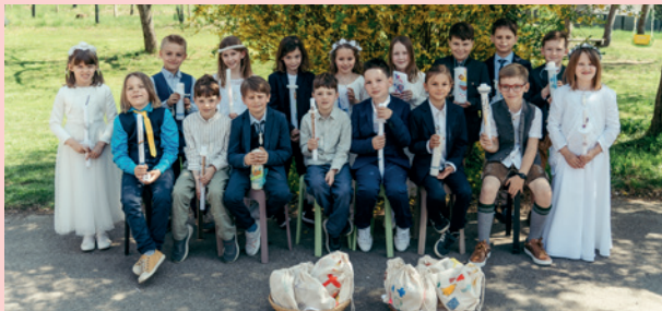
VS Raaba | Messendorf