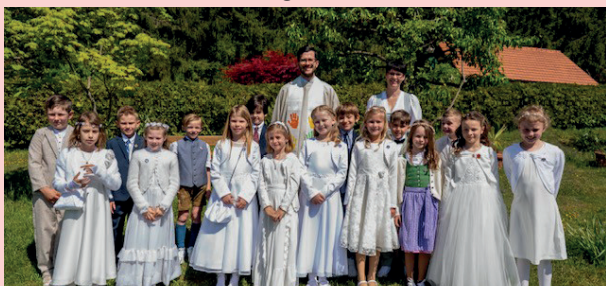
VS Pachern | Autal