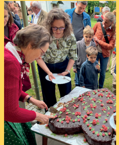
Muttertag | St. Peter