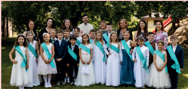
VS Engelsdorf | Graz-Liebenau St. Paul | © Sonja Banfy