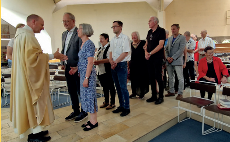
Ehejubiläum | Graz-Süd